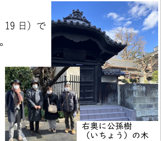
右奥に公孫樹（いちょう）の木

今回巡った所は漫画「あとかたの街」に描かれていた地域と近いこともあり、戦跡が点から面になり、戦争は点だけでは終わらないということを改めて感じた。