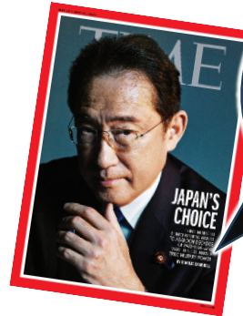
タイム誌 5/22 号 タイトル「日本の選択」

日本を戦争する国にさせないために私たち昭和区 9 条の会は何をしたら良いのでしょうか？ 憲法 9 条を守るために何ができるのでしょうか？ 一人でも多くの会員の方たちの参加で一緒に考え合う総会にしましょう。